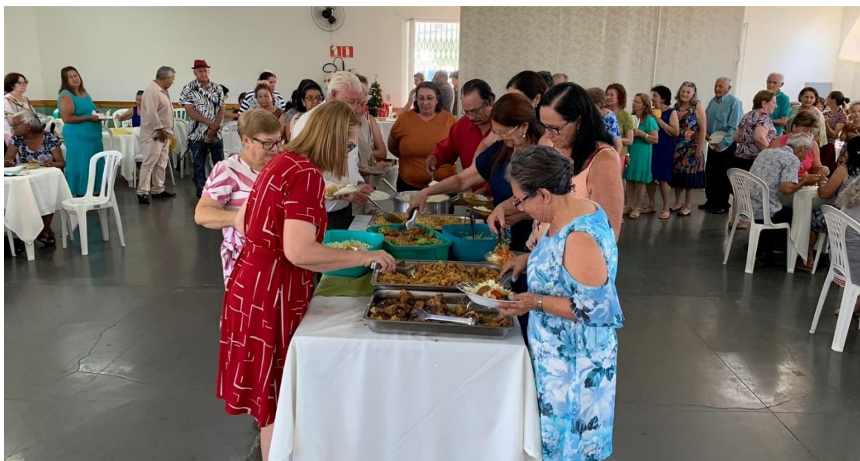
Encerramento Serviço de Convivência e Fortalecimento de Vínculos para idosos em parceria com Conselho dos Direitos do Idoso- almoço e entrega de kits de natal