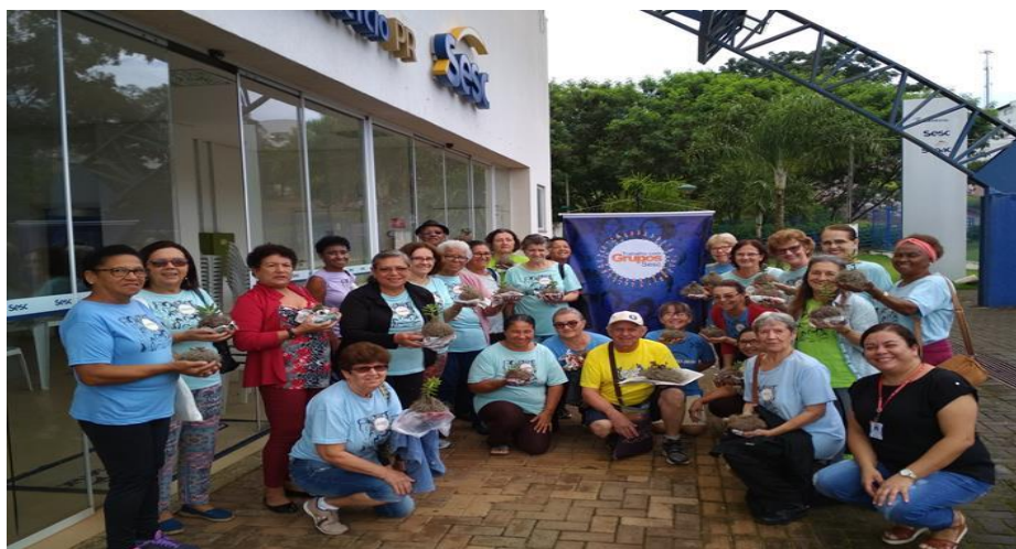
Oficina da memória