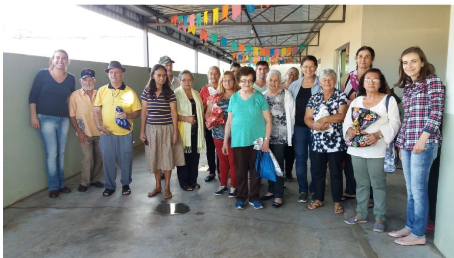
GRUPO REALIZADO PELA EQUIPE DO CREAS COM IDOSOS