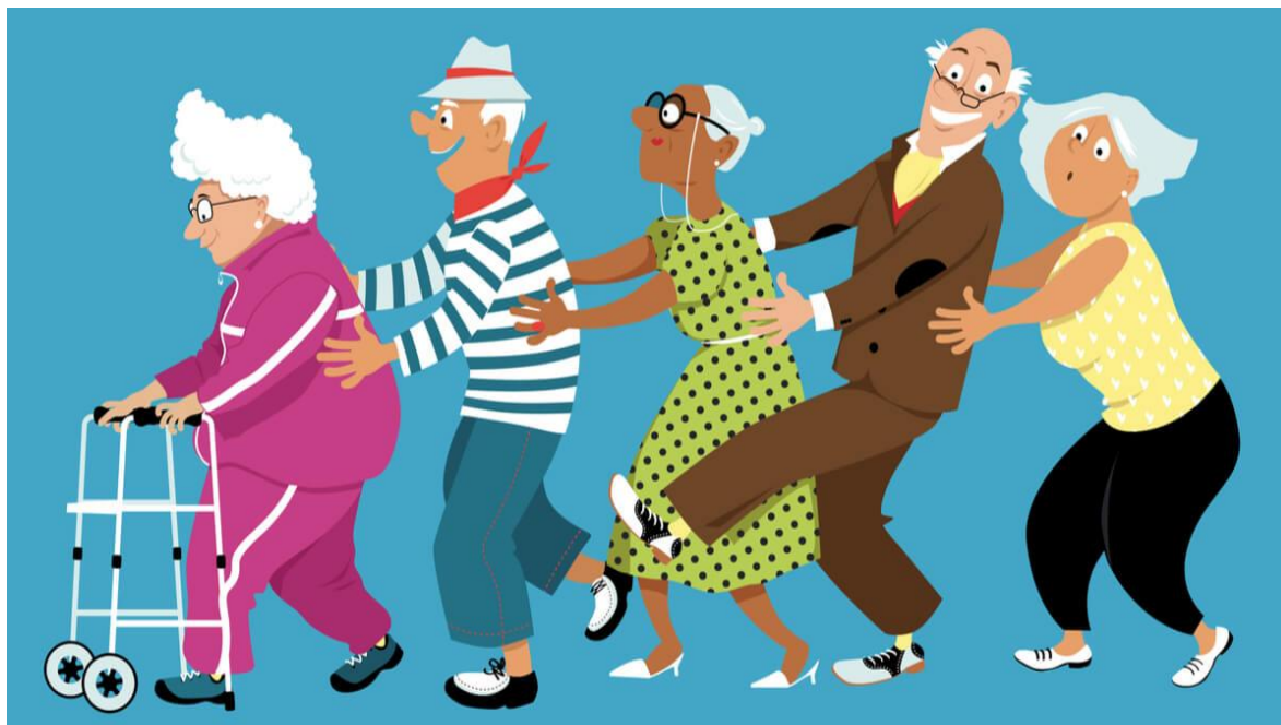
Centro Cultural da Melhor Idade

Ações para melhoria na qualidade de vida dos idosos