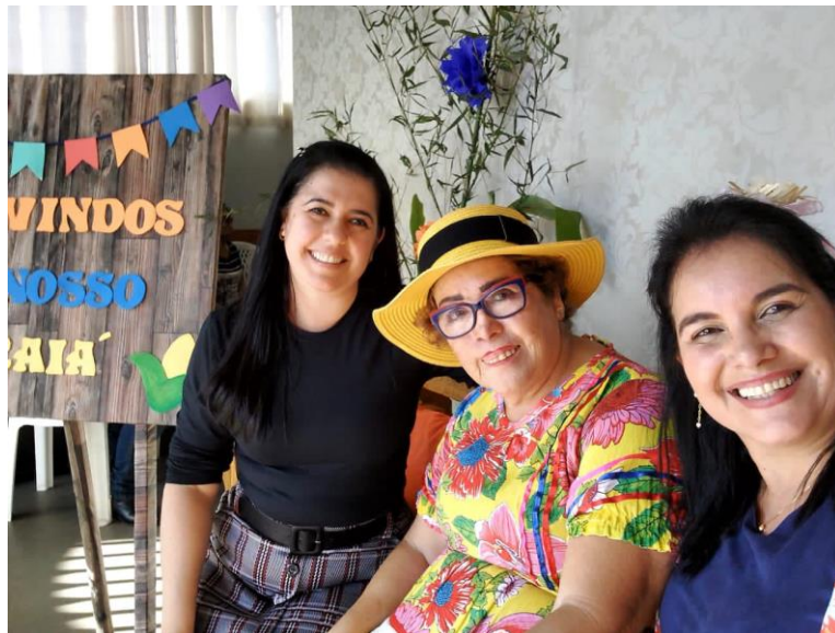
Campanha do cobertor